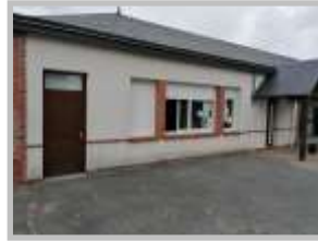
Salle 2: classe des ce1ce2 de Mme Jourdain et direction .