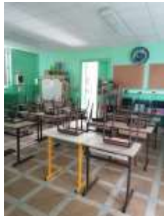
Salle 1: classe des cm1 de Mme Gnahoré