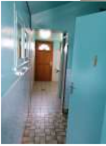
Le préau et les toilettes