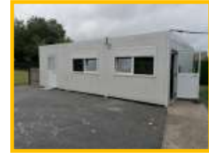
Salle 3: classe des cm2 de Mme Dagorn